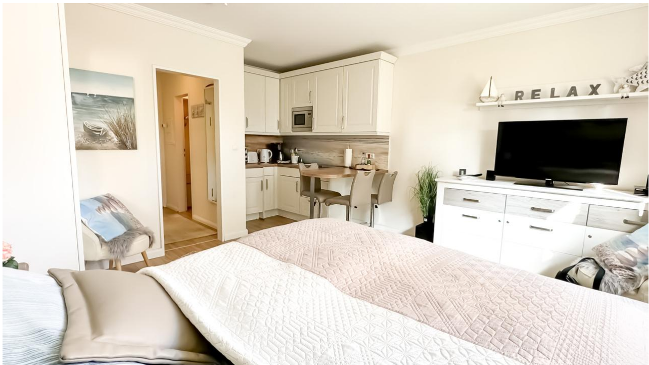
Ganz nach dem Motto: Relax!