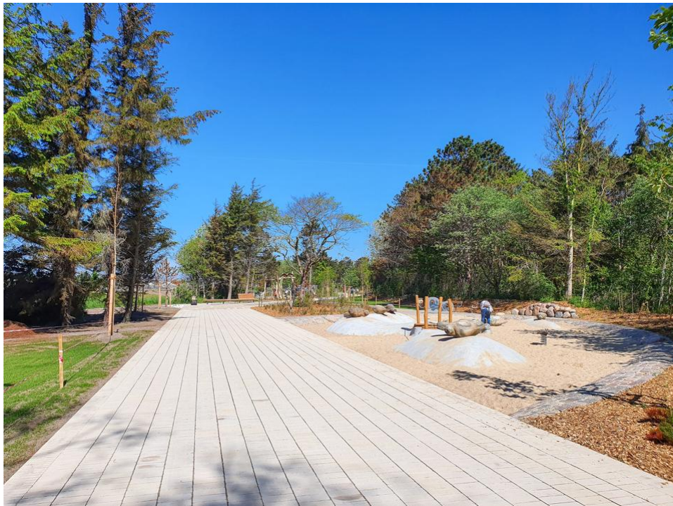
Kürpromenade mit verschiedenen Aktivitäten für Groß und klein.