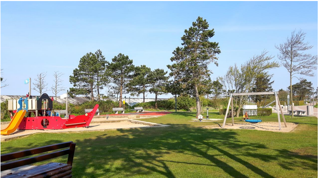
Spielplätze für Kinder und Eltern :)