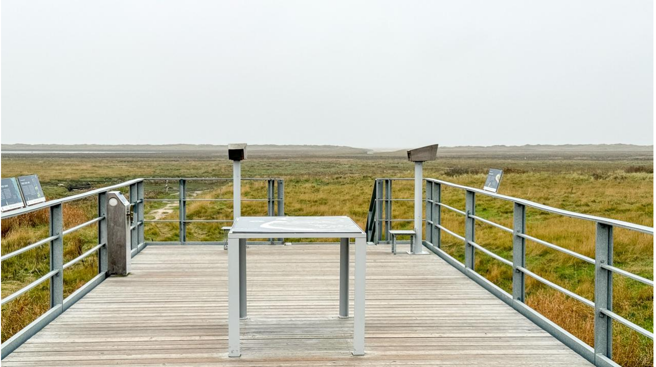
Aussicht! Nordseeluft und Meer!