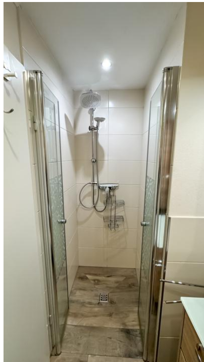
Ebenerdig begehbare Dusche