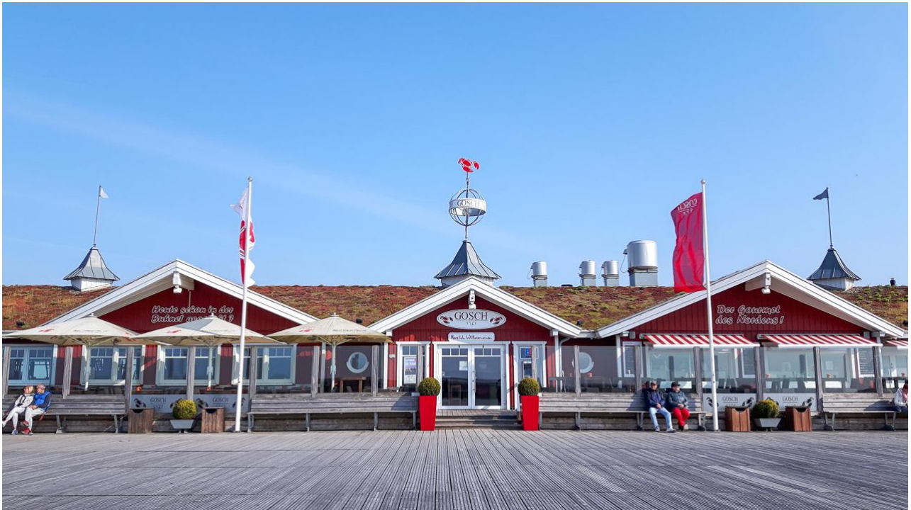
Beliebte Fischgastronomie auf der Seebrücke in SPO.