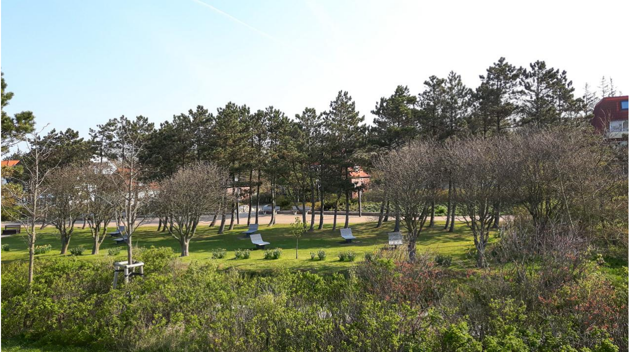
Sitzgelegenheiten im Grünen