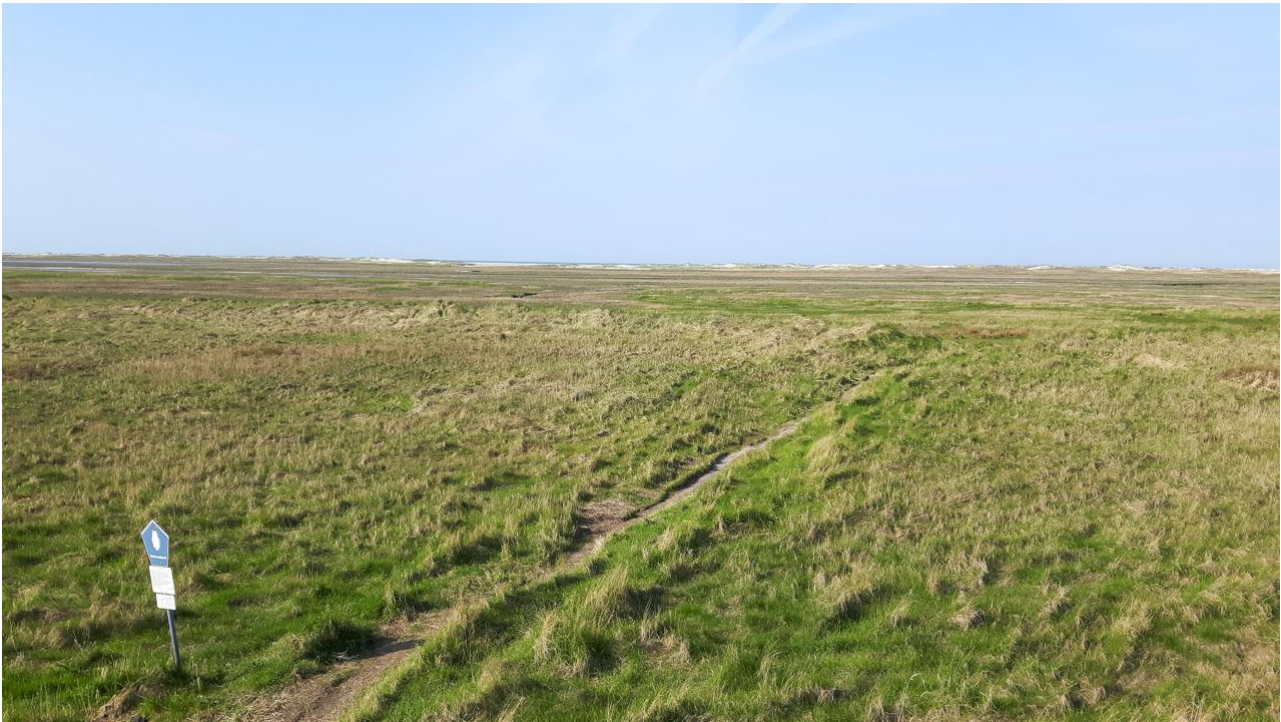
Dünen und Salzwiesen.