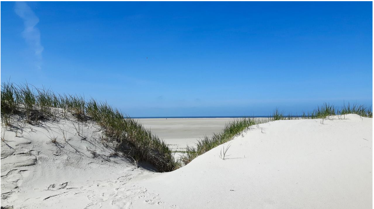
Ab an den Strand von Sankt Peter-Ording!