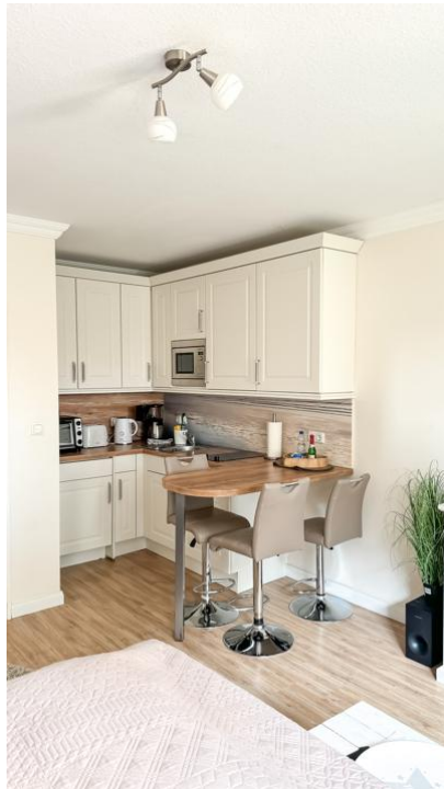
Küchenzeile mit Tresen